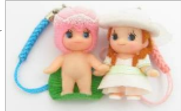
写真左：モネ《睡蓮》キューピー（第2弾）