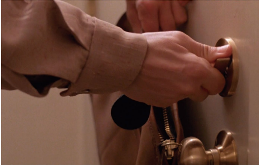
《ドア》 2022年 シングル・チャンネル・ビデオ、 カラー／モノクロ、サウンド 無限ループ