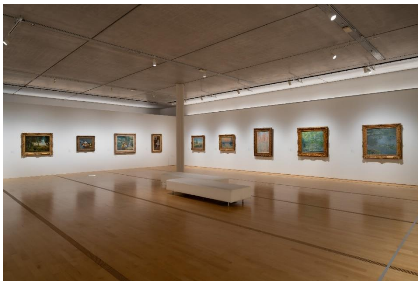
「ポーラ美術館コレクション選 西洋絵画 印象派から20世紀前半のフランス絵画」展示風景