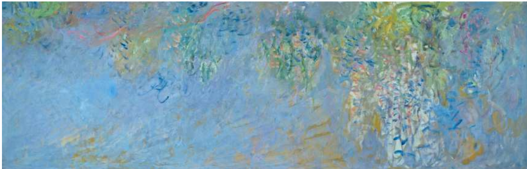
クロード・モネ 《藤》 1919-1920年 油彩／カンヴァス マルモッタン・モネ美術館

このたび、マルモッタン・モネ美術館（フランス・パリ）から《藤》、モビリエ・ナショナル（フランス・パリ）からマティス原画のタペストリー《リュートを持つ女性》など、展覧会を構成する重要な作品の数々が日本に到着し、新たに展示いたしました。